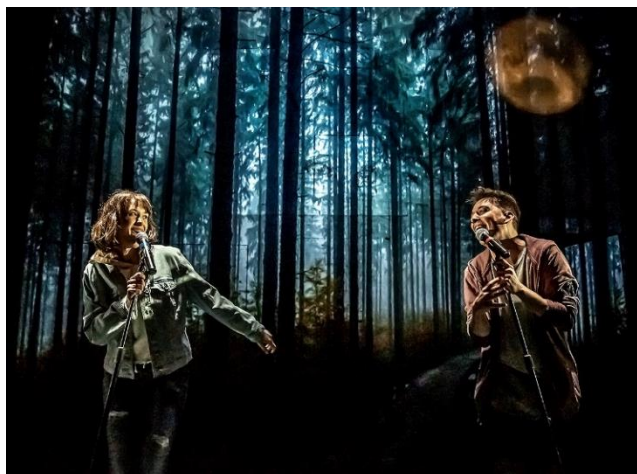
Le Scriptarium 2019.

Ce commissaire propose un univers, un thème ou une forme d'écriture que les adolescents explorent en classe. Inspirés par cette proposition artistique, plus de 1 500 adolescents prennent la plume et plongent dans ce projet d'écriture. Après une première sélection de textes en classe, les professeurs envoient les coups de cœur de leurs élèves. Puis, un comité artistique sélectionne ensuite 24 jeunes auteurs qui sont conviés à participer à un stage de création intensif auprès de professionnels du milieu théâtral.