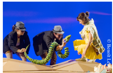
MON PETIT PRINCE