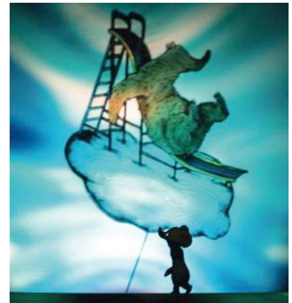
Le Ciel des ours

Librement inspiré de l'album illustré Un paradis pour Petit Ours de Dolf Werroen et Wolf Erlbruch, Le Ciel des ours nous transporte dans un univers poétique et magique qui laisse toute la place à l'imagination et à l'expérience des jeunes spectateurs. En 2013, Teatro Gioco Vita présentait aux Gros Becs le spectacle Chien Bleu , véritable coup de cœur du public. La compagnie a joué en Europe, aux États-Unis, au Brésil, au Mexique, au Japon, en Chine, en Israël, à Taïwan et en Turquie.